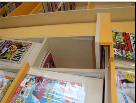
SNÍMKY Z ARCHIVU CEIBA, ZOBRAZENÉ DEZÉNY NEODPOVÍDAJÍ NAŠEMU NÁVRHU!